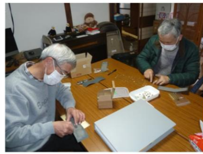
空気漏れ止め部品の製作