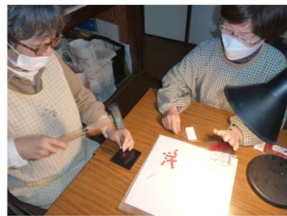
パンチングフェルトの製作

部品製作が続いています。アクション関連は部品点数が多くなりがちのため、その製作も根気が必要になります。今回は既存部品の改造や刷新を行いますが、ボランティアの方々に助けられ、コツコツ進めています。