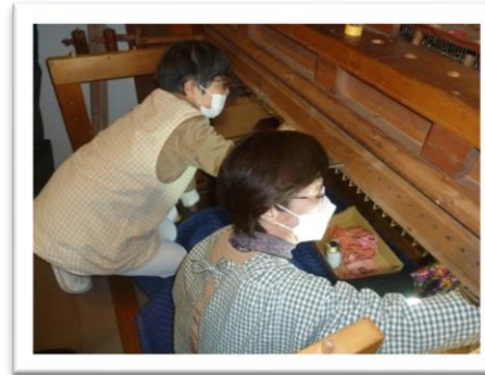
チェスト内部の清掃