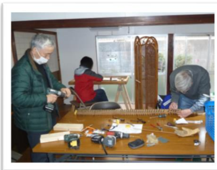
アクション摩擦低減のための 改良