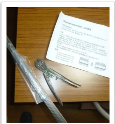
剛性不足な部品の改良