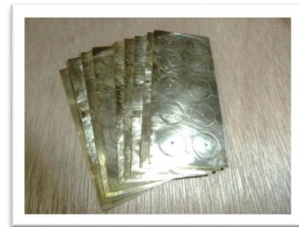
今回の修理のカギとなる シール部品 レーザー加工機で 製作いただきました