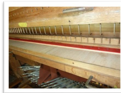
シール部品を使うためのチェ スト側の改造