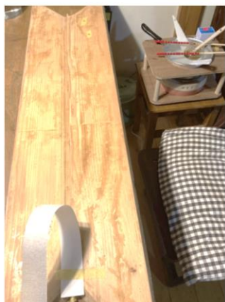
羊皮紙貼付け中 ニカワ溶解装置も活躍

羊皮紙を貼り終わった後、空気漏れを防ぐための革を貼っていくこととなります。革は貼る前に「革漉き」という端の厚みを削ぐ作業を行います。良く研いだ「革包丁」という手道具で一つ一つ処理するため手間が掛かりますが、耐久性を得るために必要な処理です。