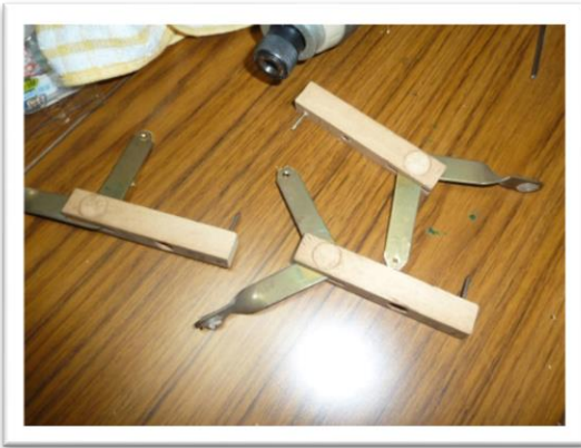
加工されたアクション部品